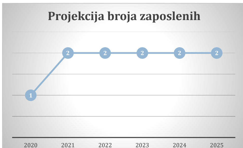
Grafički prikaz: Plan kretanja broja zaposlenih po godinama